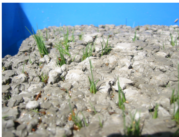
当社工場内でポラリスに植栽したところ発芽しました。

また土壌の乾燥化を防ぎ、地下水を保水することで夏季には気化熱による地表面の冷却を促進し、ヒートアイランド対策になります。