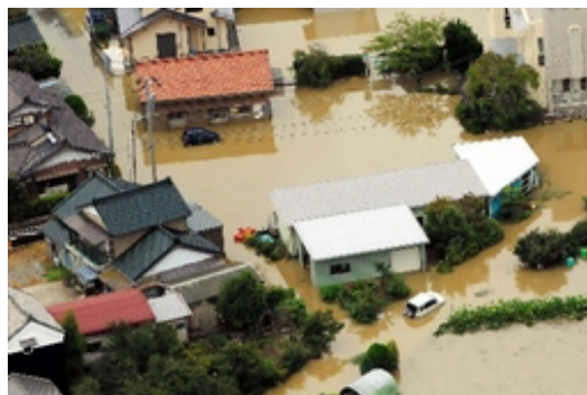
平成20年8月豪雨による水害（毎日新聞記事より）

かつては田や畑が多く点在し、雨水の多くは自然の土の中に浸透し、浸透した水は地下水や湧き水となり河川へゆっくり流れていましたが、現在は都市整備により地面はアスファルトやコンクリートに覆われたため短期集中した雨水は一気に下水道や河川に流れ込むため河川の氾濫や水害が発生しやすくなります。